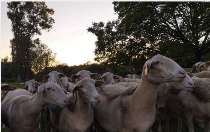
Crédit photo : Brebis soleil couchant (La Bergerie des hauts du lac)