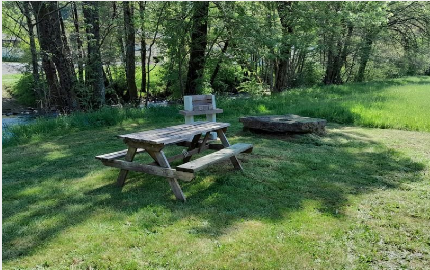
Crédit photo : Aire de pique-nique Le Moulin du Teinturier (Le Moulin du Teinturier)