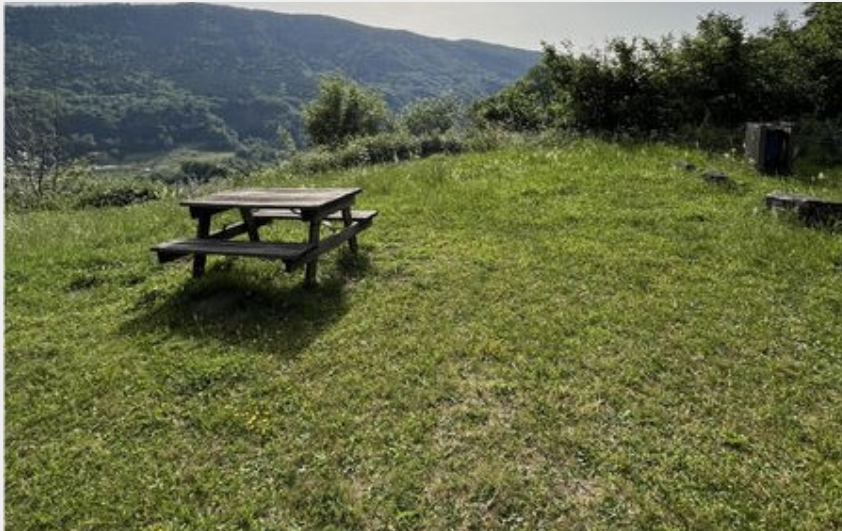
Aire de pique-nique direction Col d'Aulac -Le Falgoux