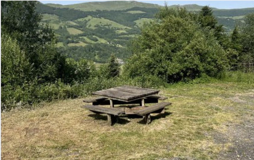
Crédit photo : Aire de pique route du Col de Néronne (Mairie Le Falgoux)