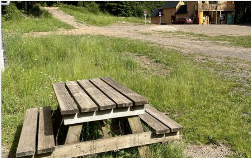
Crédit photo : Aire de pique-nique Pont des eaux - Le Falgoux (Mairie Le Falgoux)