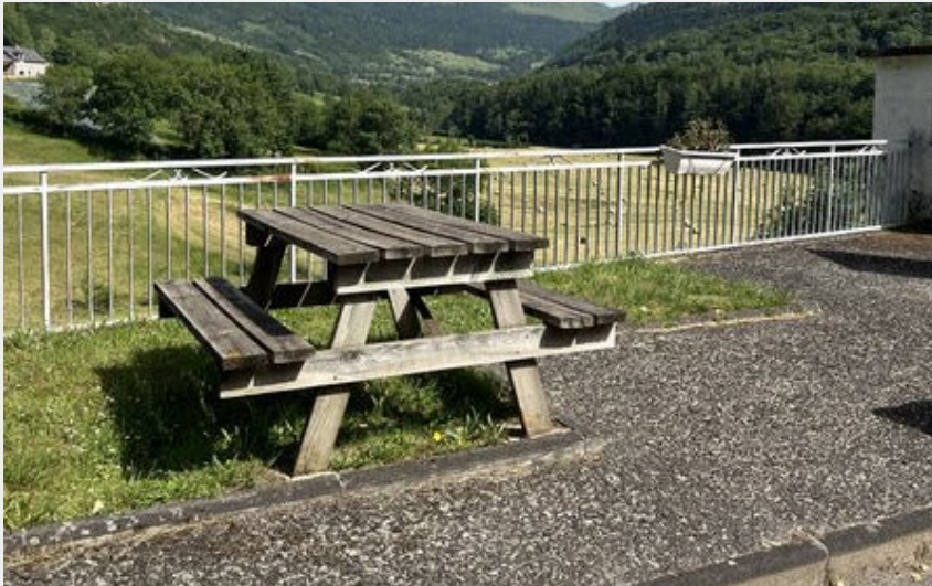
Crédit photo : Aire de pique-nique Le Falgoux en direction de la station ou Onirika (Mairie Le Falgoux)