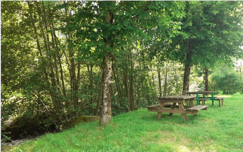
Crédit photo : Aire de pique-nique Restivalgues - Fontanges (Mairie Fontanges)