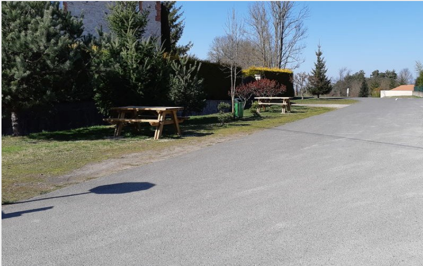
Crédit photo : Aire de pique-nique Périgueux Gare - Aventure du Rail (Valérie BOURGIER OTLF)