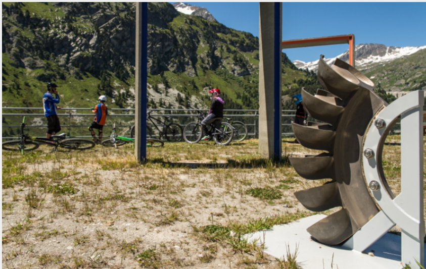
Bélvédère de Plan d'Aval à Aussois