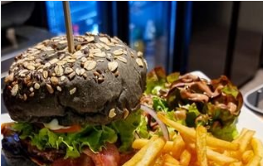
Nouveau restaurant à Bonneval sur Arc : le Rockabar