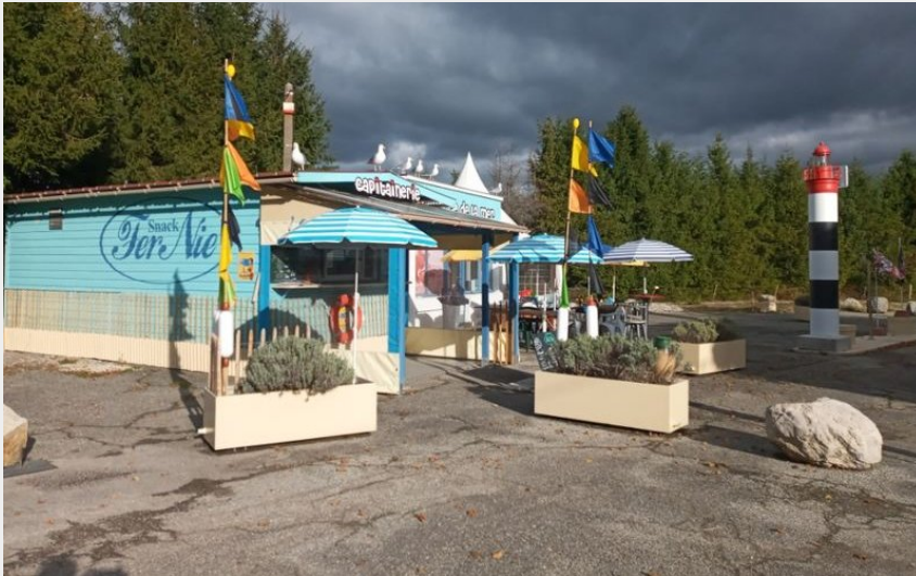
Crédit photo : Le snack Fernie vous accueille sur la route de la mer !