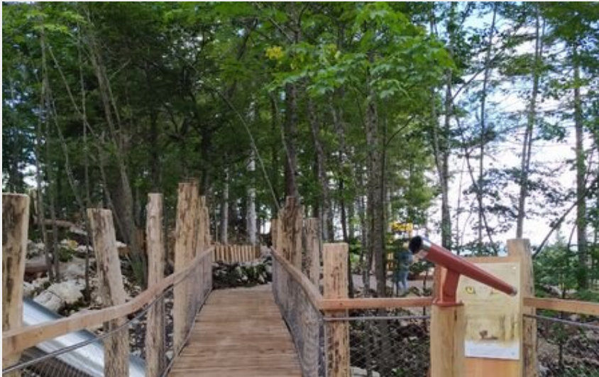
La forêt mystérieuse