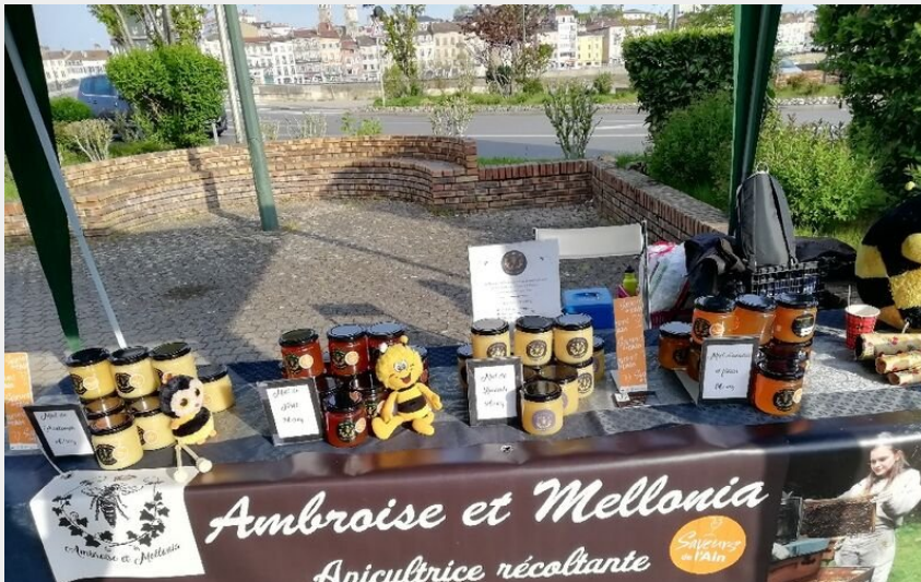
Stand des produits apicoles Ambroise et Mellonia