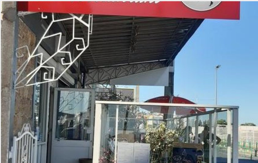
Crédit photo : terrasse en façade (Restaurant L'Atelier de Virginie)