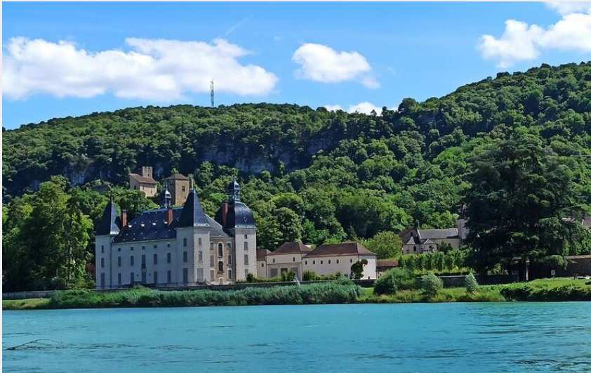
château de Vertrieu vue de l'aire de pique-nique