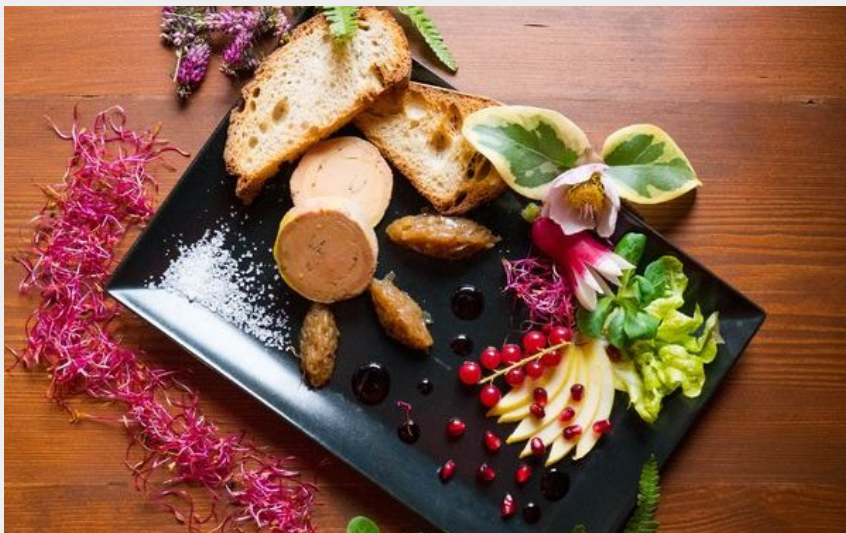
Crédit photo : Foie gras maison - Entre Lacs et Collines (Entre Lacs et Collines)