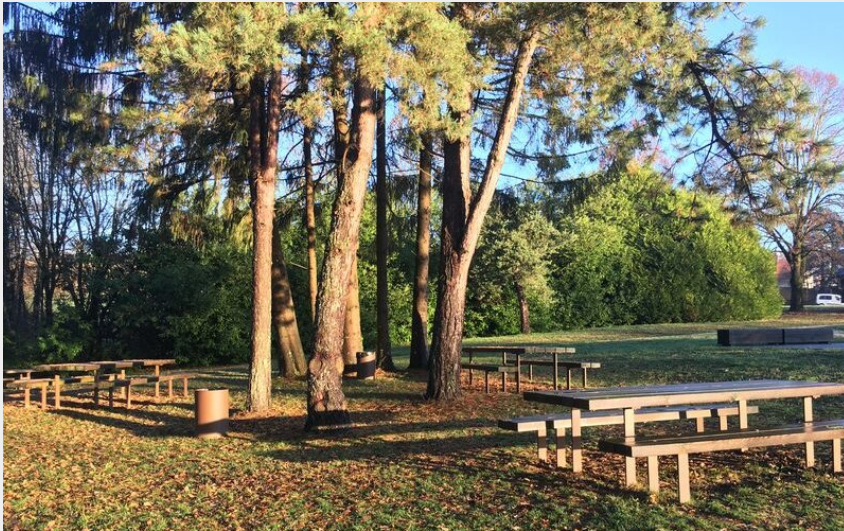
Crédit photo : Aire de pique-nique du Site des Ponts de la Caille (©AlterAlpa Tourisme)