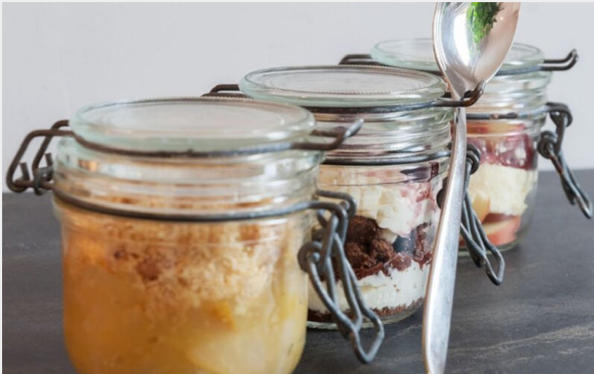
Crédit : Plat - Restaurant - Le Petit Grailou (Restaurant - Le Petit Grailou)