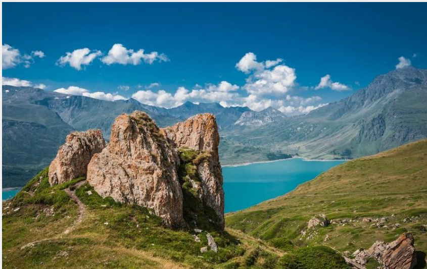
vue depuis les alpages sur le lac du mont cenis