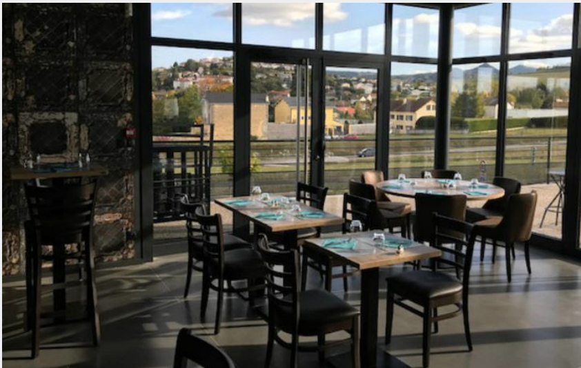
Crédit photo : Coin droit salle de restauration (RES_Brasserie-le-Y_Yssingaux_©R.Jurdie_2018_web)