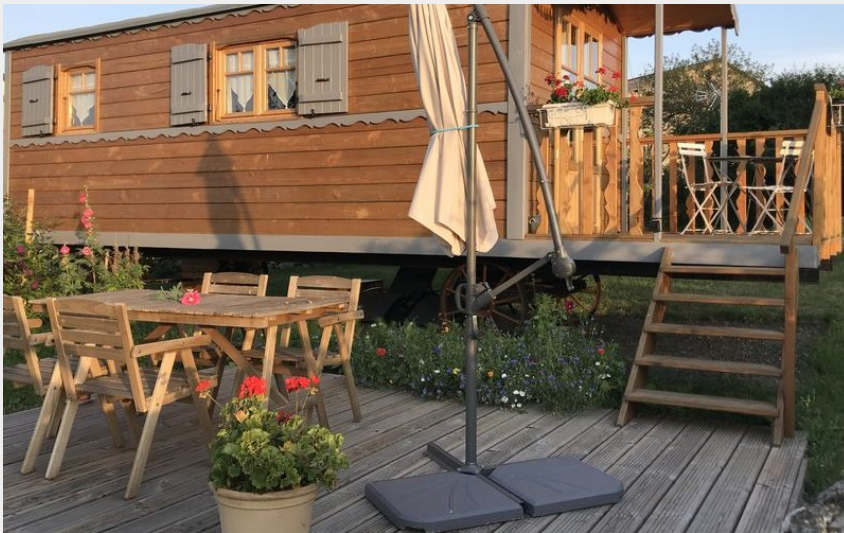
Crédit photo : La roulotte au fond du pré Coltines (Didier Amarger)