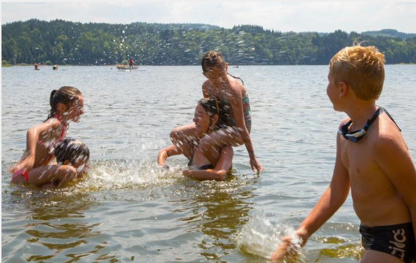
Crédit photo : Baignade - Lac de Lavalette - Auvergne - haute-loire (L. Barruel)