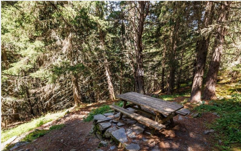
Crédit : Aire de pique-nique du sommet du sentier botanique_Méribel