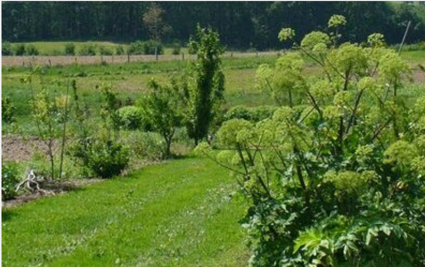
Crédit photo : Sentier botanique (©Les Ateliers de la Grange - 2014)