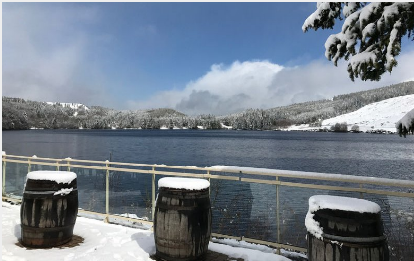
Crédit photo : Auberge du lac de Guéry (DR Office de tourisme du Sancy)