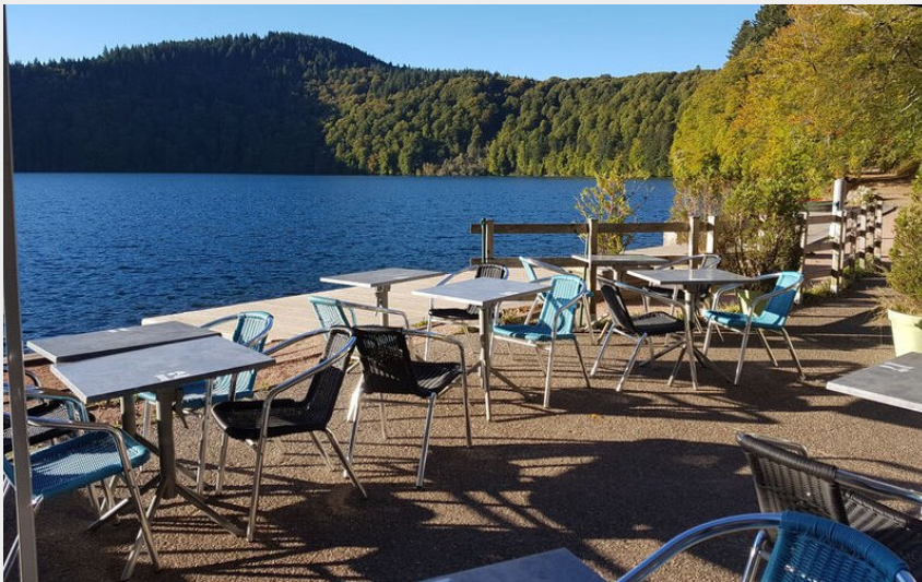
Restaurant du lac Pavin