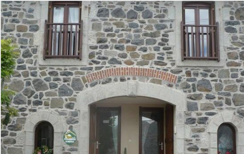
Crédit : Facade maison coté rue du champ de foire