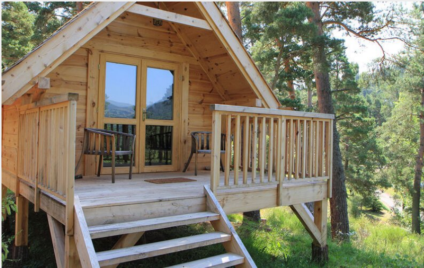
Crédit : Le Domaine du Lac Chambon (DR Office de tourisme du Sancy)