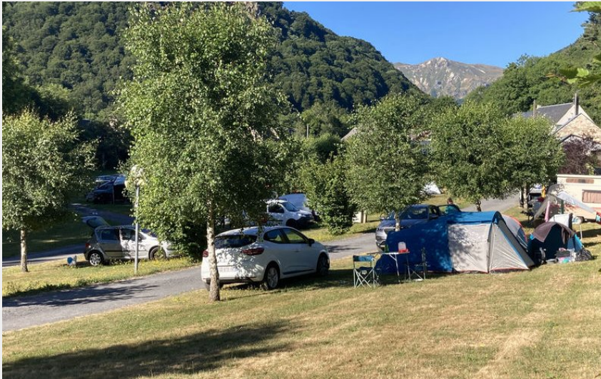
Crédit photo : Camping de Voissières (DR Office de tourisme du Sancy)