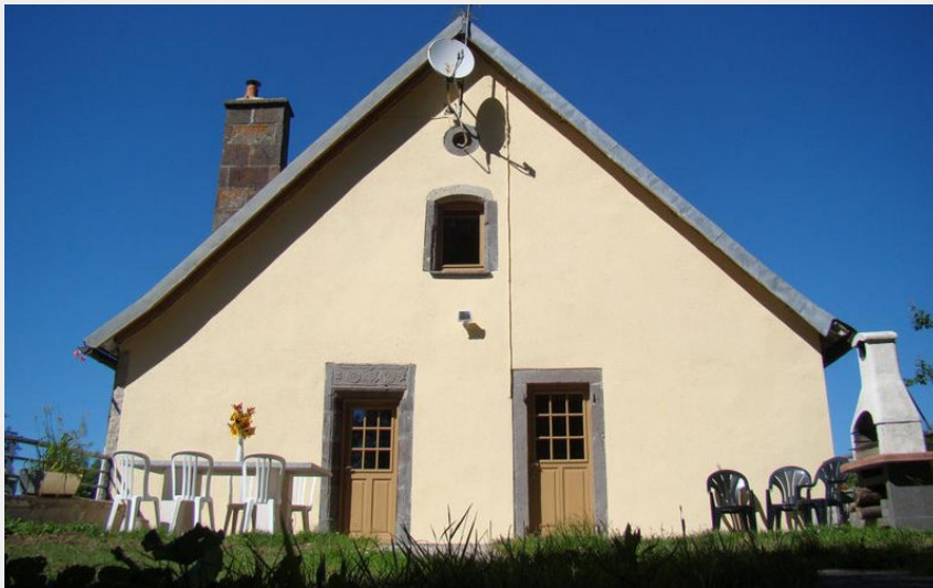
Crédit photo : Chambres d'hôtes Beluga (DR Office de tourisme du Sancy)